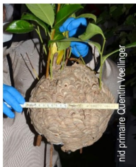
nid primaire Quentin Voellinger