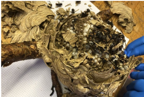
Un nid secondaire d'environ 1 mètre de haut peut contenir jusqu'à 8'000 frelons dont 8 futures reines.

Afin de limiter la prolifération des frelons asiatiques sur le territoire cantonal, la Direction générale de l'environnement a mandaté le Professeur Daniel Cherix, expert en la matière, pour conduire des opérations avec l'appui de la Protection civile. Cette collaboration est une première suisse dans la lutte contre cette espèce invasive.