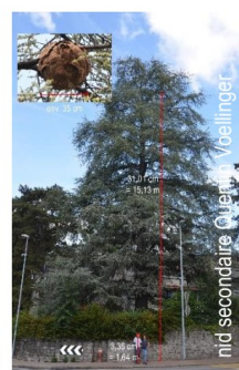
nid secondaire Quentin Voellinger

Dans canopée des arbres jusqu'à 30m de haut