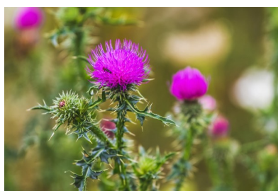
Chardons des champs