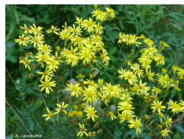
Séneçon du Cap