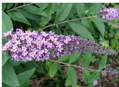
Buddléa de David